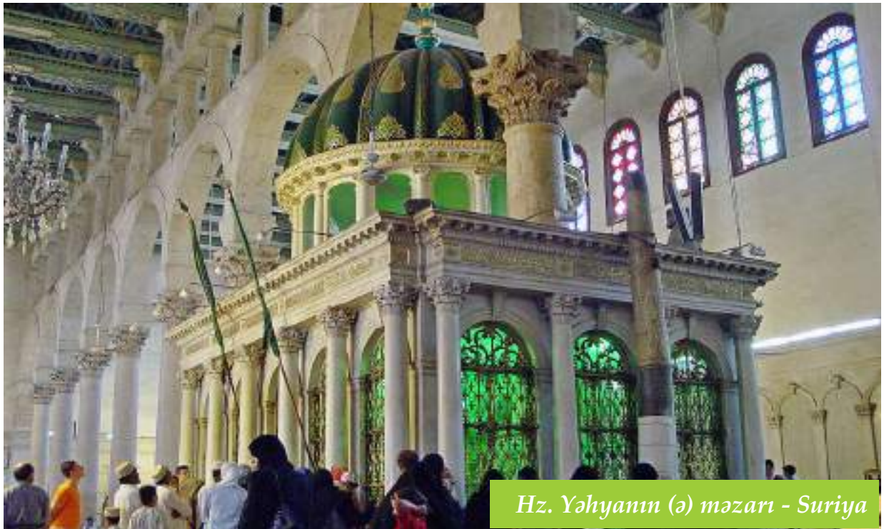
Hz. Yəhyanın (ə) məzarı - Suriya

Herodisin qardaşının gözəl bir həyat yoldaşı vardı. Herodis onu zorla özünə yoldaş etmək üçün qardaşından aldı. Heç kəs onun bu işinə e`tiraz etmədi. Yalnız Yəhya qəsb edən insana dedi: